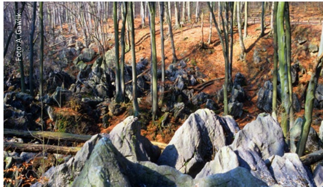
Kayalık Denizi Hemer

Ruhr Bölgesi JeoParkı'nın sloganı, "Hammadde Cenneti Ruhr Bölgesi – Jeoloji Deneyimi" olup, bölgedeki gelişimin merkez noktasını işaret etmektedir. Çünkü burada maden kaynaklarının çeşitliliği ve önemi her zaman merkezi rol oynamıştır: Taş kömürü şüphesiz en iyi bilinen ve en önemli hammadde olmakla