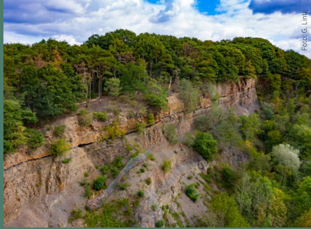
Dünkelberg Taş Ocağı