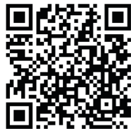
Infos zu den Zielen

Auf unserer Internetseite finden Sie ausführliche Informationen zu den Zielen und haben unter anderem die Möglichkeit, Wegstrecken als GPX-Dateien herunterzuladen. Darüber hinaus hat der GeoPark eine Broschüre mit der Beschreibung aller Ausflugsziele herausgegeben.